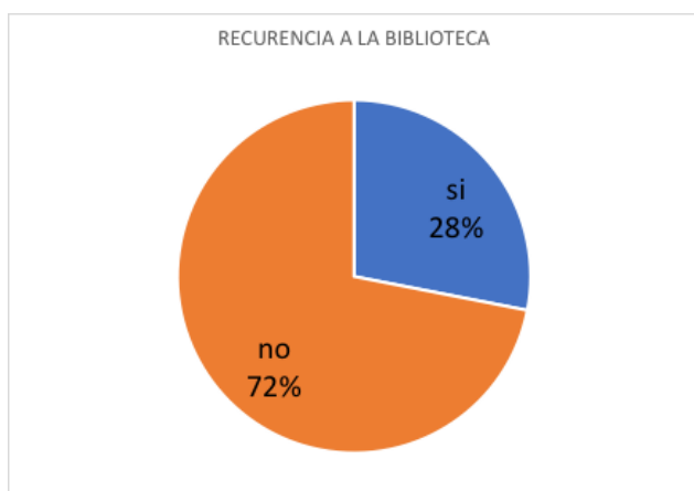
Grafica 3 usted recurre a la biblioteca del colegio

En la gráfica 3, se obtuvo un resultado de "no recurren a la Biblioteca" (72%) y "Si recurren a la Biblioteca" (28%) esto nos indica que, aunque en el colegio exista un gran grupo de estudiantes lectores estos no hacen el uso correcto para la biblioteca.