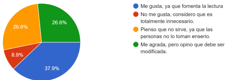
Gráfica 2 Que opina usted acerca de lectionizate

El proyecto denominado "Lectonízate" nació a partir de la iniciativa de estudiantes que en el año 2014 cursaban grado once. Este surgió con la idea de fomentar la lectura utilizando los primeros 15 minutos de martes a viernes, actualmente, 5 años después de ejecutado por primera vez, se analiza la posición de los estudiantes con respecto al proyecto. Los resultados denotan una inconformidad de modo que más de la mitad de la población encuestada (53.2%) se sienten identificados con las opciones "Me agrada, pero opino que debe ser modificada" y "Pienso que no sirve, ya que las personas no lo toman en serio".